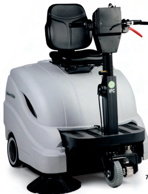
712 RIDER ET / ST