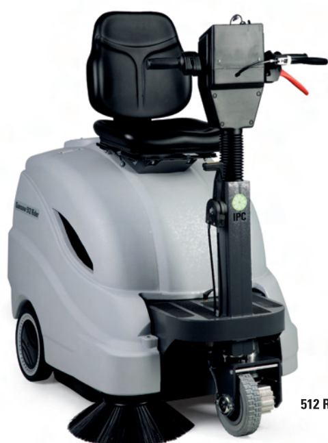
512 RIDER ET / ST